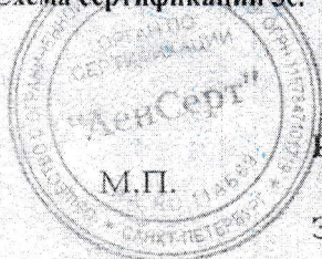
Схема сертификации Зс.